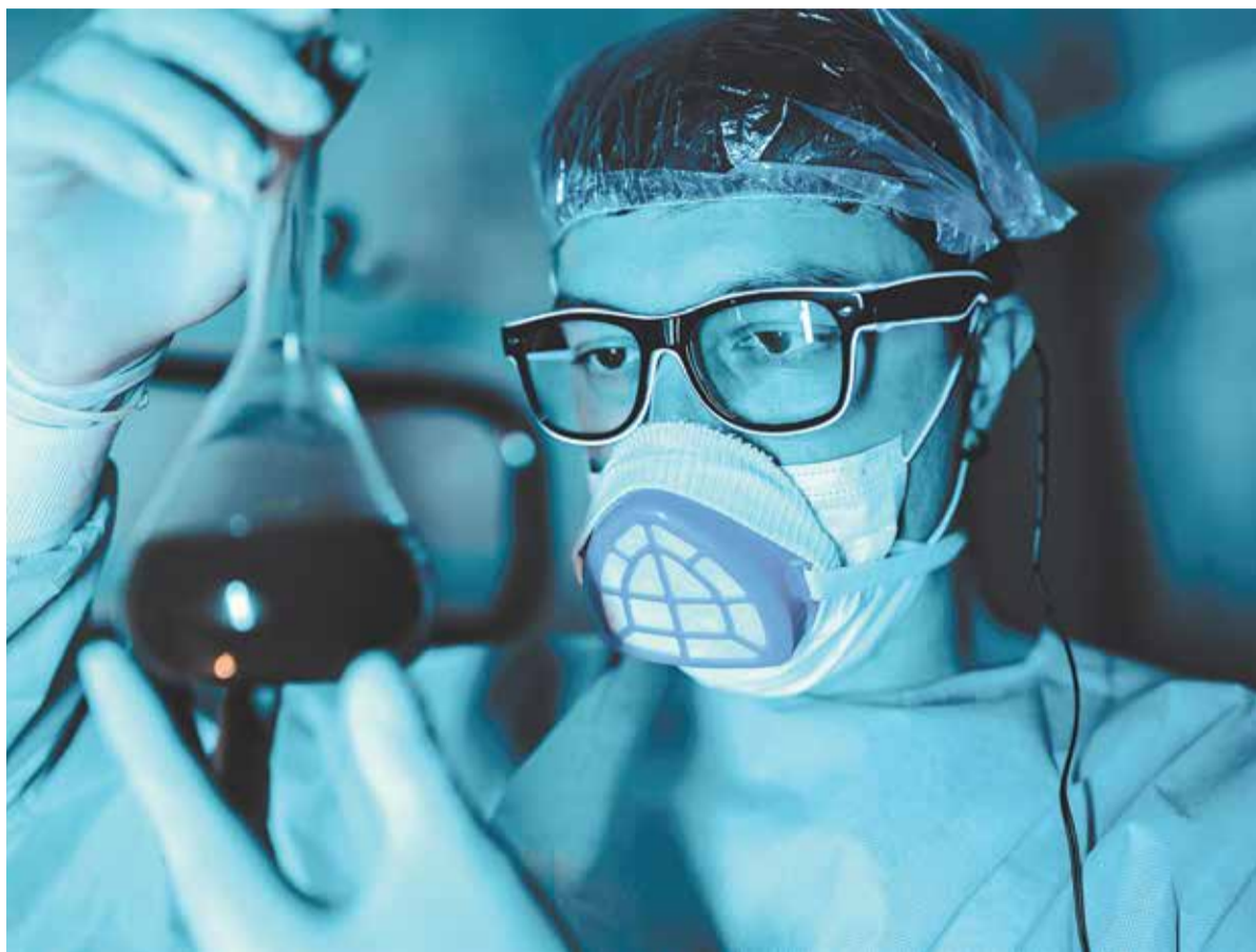
Частные медики хотят быть уравниваемыми в правах с государственными